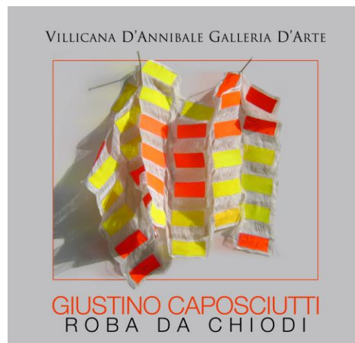
Copertina del catalogo in vendita in galleria o a www.VillicanaDAnnibale.com